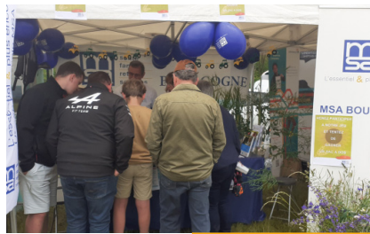
Fête de l'agriculture