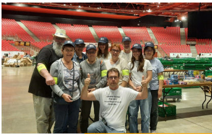
Braderie solidaire FNAC