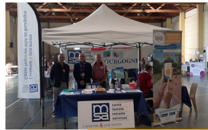
Salon seniors et aidants