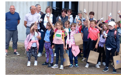
Découverte de la ferme