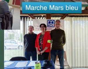
Marche Mars bleu

Les délégués jouent un rôle essentiel au service de la population agricole.