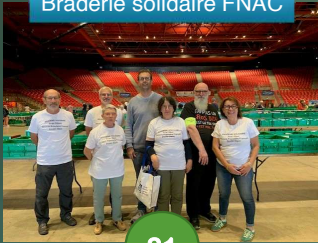
Braderie solidaire FNAC