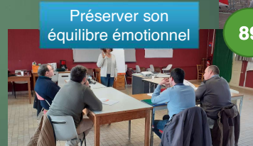
Préserver son équilibre émotionnel