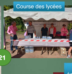
Course des lycées