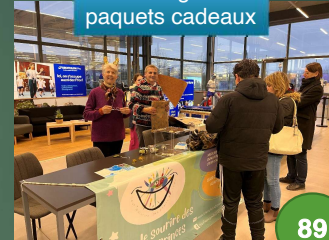
Emballage des paquets cadeaux